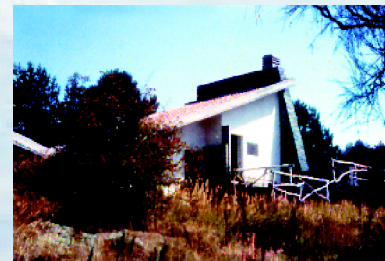
Giardino Nuova Gussonea Rifugio "Valerio Giacomini"